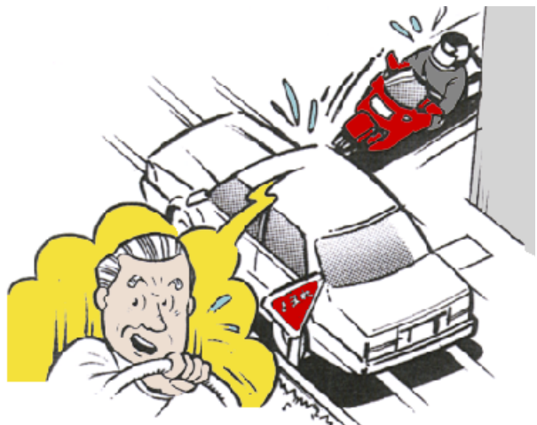
一時停止を怠ると、それは事故の第1歩!